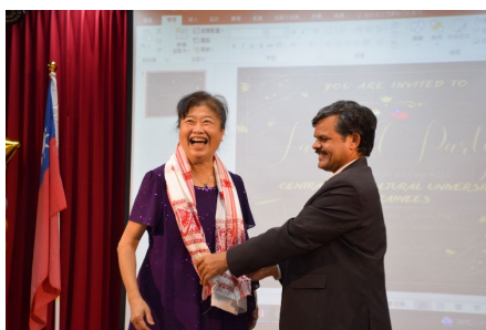
▲印度中央農業大學 農業人才培訓營結訓 典禮暨歡送午宴