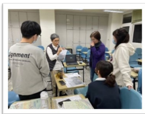
▲ 在職培訓：期中培訓-分科教學討論