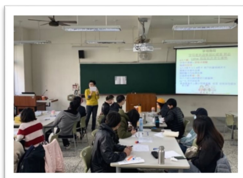
▲ 在職培訓：期初培訓-分科教學、課師自我認識