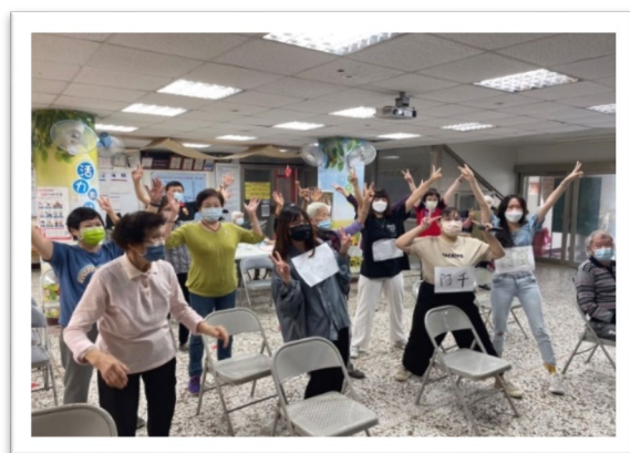
▲ 營養學課程-與養護中心長者互動