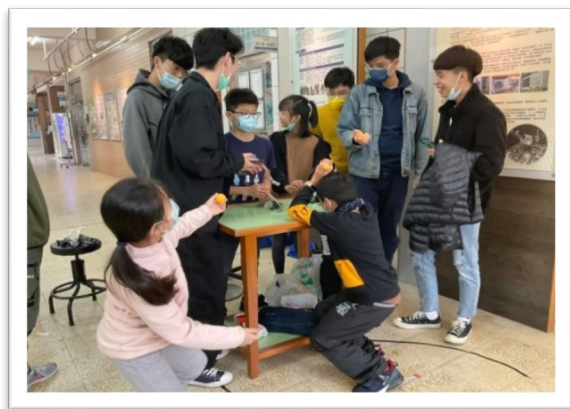
▲ 電子學實驗課程-讓小學生體驗拋物線及物體彈性實驗