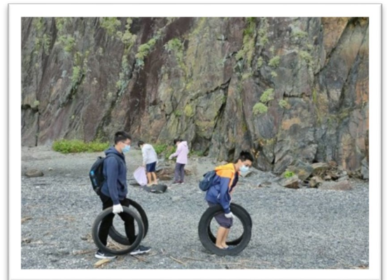
▲ 在職培訓：期中培訓-分科教學討論