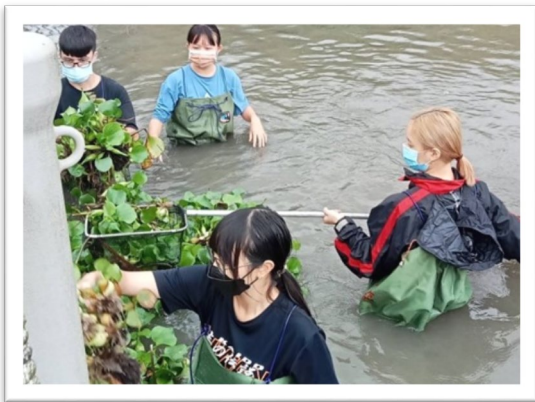
▲ 協助壯圍後埤社區清除布袋蓮