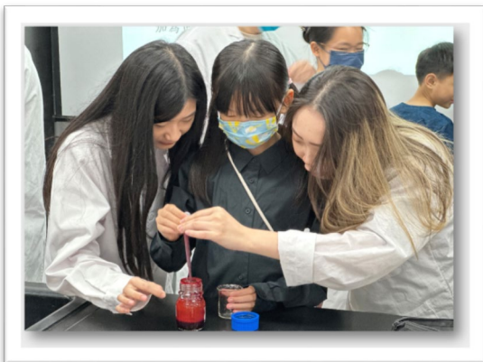
▲ 在職培訓：期中培訓-分科教學討論