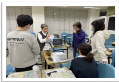
▲ 在職培訓：期中培訓-分科教學討論