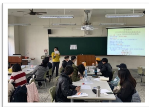
▲ 在職培訓：期初培訓-分科教學、課師自我認識