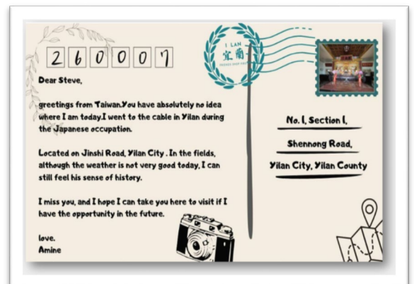
▲ 在職培訓：期中培訓-分科教學討論