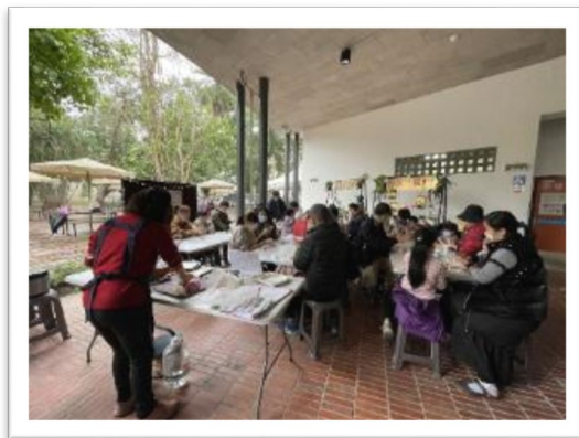
▲ 2022/12/17食農教育-親子冬至搓湯圓