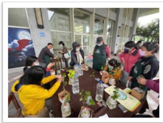
▲ 2022/4/2食農教育-小茶魚栽