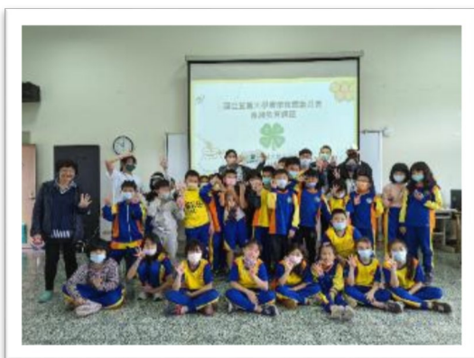
▲ 2022/3/23食農教育-蜂蜜晶球DIY