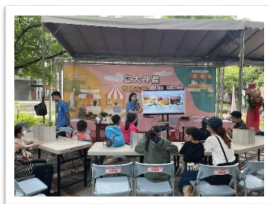
▲ 2022/5/14食農教育-環保DIY、米香DIY