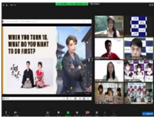
以貼近學生生活的話題展開討論