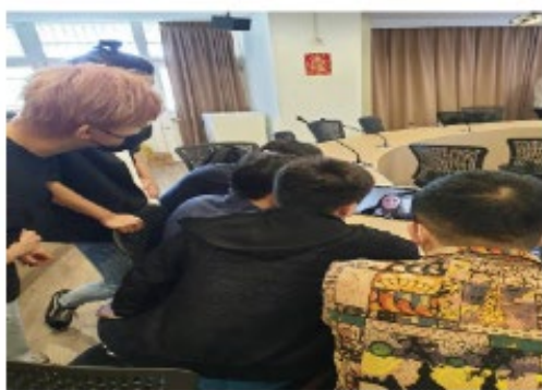
參與學生利用 EMBA 視訊教室與紐西蘭學伴進行分組第一次視訊對談