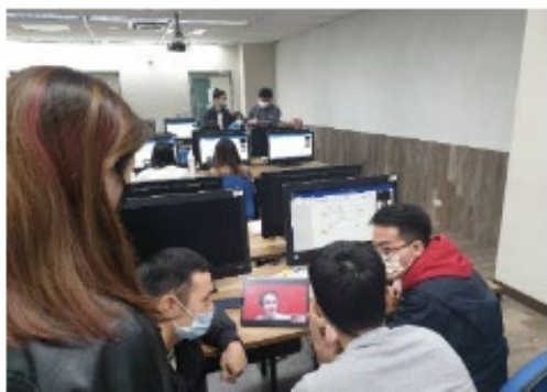
學生與紐西蘭學伴於電腦教室三進行分組視訊對話