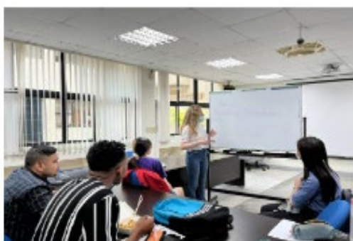
俄羅斯籍外籍生介紹自己名字的含義