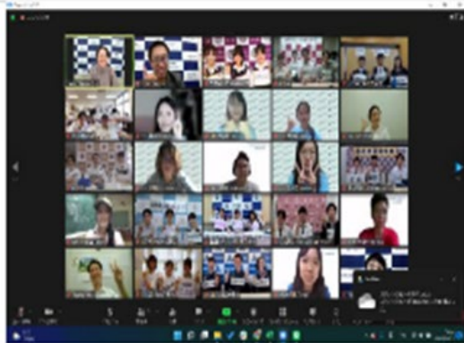
活動結束後再一起拍攝大合照