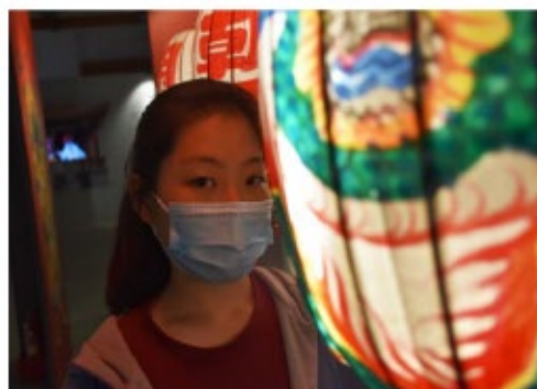
境外生於台中酒廠參觀台灣文化之展覽