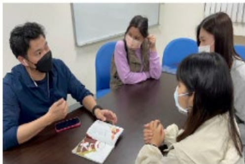
外籍生以故事書方式練習中文單字