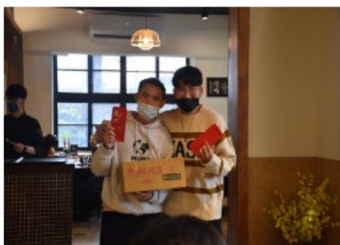
僑生社團精心準備小獎勵予參與活動之境外生