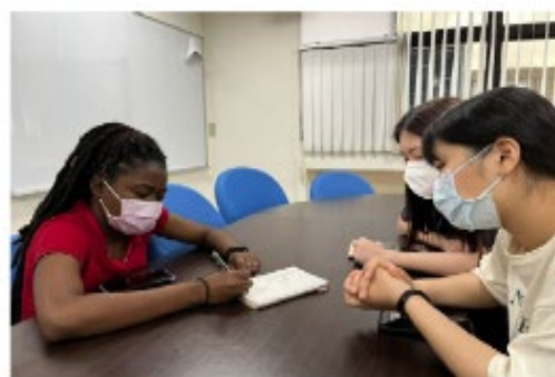
聖文森籍外籍生積極學習中文