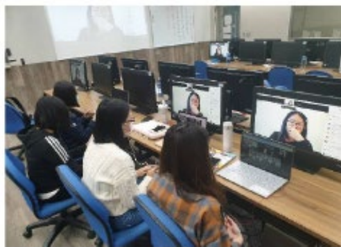
學生電腦教室運用桌電及筆電與紐西蘭學伴進行第二次視訊對話