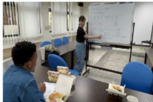
同學利用課後空閒時間進行課輔