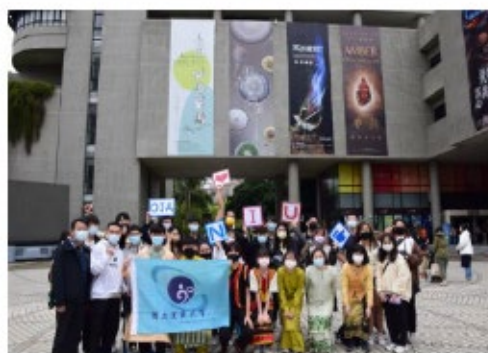
境外生著傳統服飾與國際處師長於臺中科博館前合照