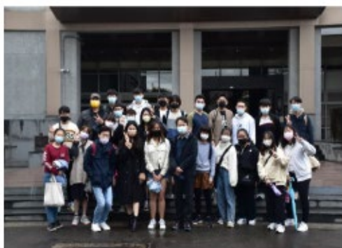
國際處師長們與境外生於台中酒廠合影