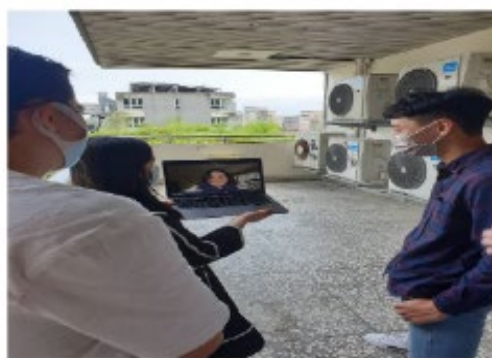
學生運用自己的筆電與紐西蘭學伴進行第一次視訊對談