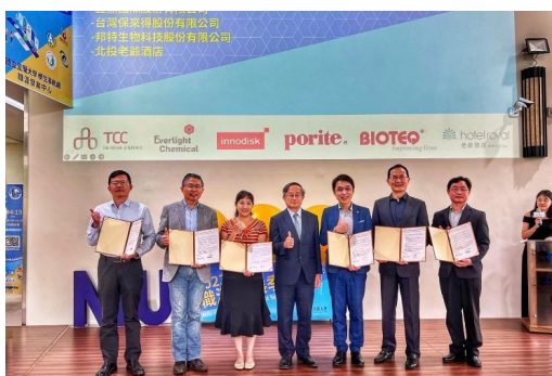
▲2023企業夥伴 締結儀式