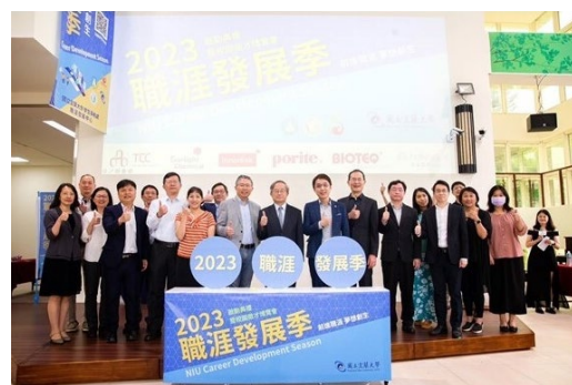
▲2023年度職涯發展季啟動儀式