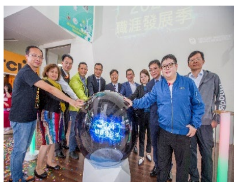
▲職涯發展季啟動典禮

本校協助學生職涯發展，順利接軌職場，補助學校結合內外部資源，規劃多樣化或系列性之職涯輔導及發展計畫，並依不同族群之獨特性，結合相關資源，針對其需求進行職涯輔導，協助青年多元職涯發展，促進青年儘早找到未來發展職志。本校於2023 年度舉辦33 場次2,635人參加，包含職人講座、手作、成果發表等多項活動，內容豐富非常精彩。