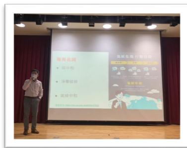
▲ 碳盤查方法簡介與相 關網路資源-SDG 13