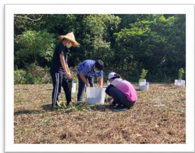
▲ 果樹栽培實作-SDG 2