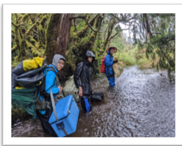
▲ 鴛鴦湖魚類及鯉魚 食性調查- SDG 15