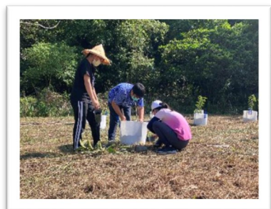
▲ 果樹栽培實作-SDG 2