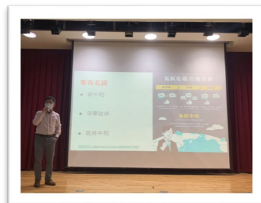
▲ 碳盤查方法簡介與相關網路資源-SDG 13