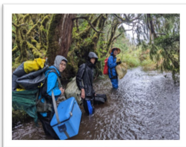
▲ 鴛鴦湖魚類及鯉魚食性調查- SDG 15